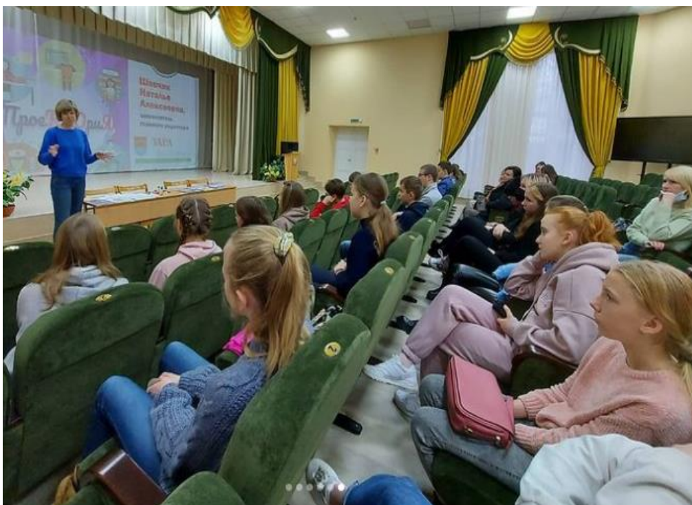
Фото 3. Встреча с заместителем главного редактора районной газеты «Зара над Неманам»