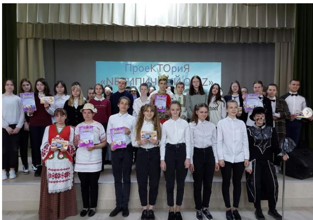
Фото 4. «НЕПІЧНИЙ QUIZ» районного проекта «Проектория»