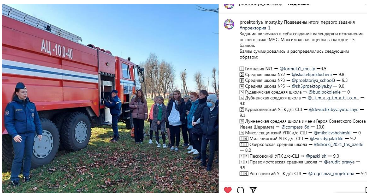
Фото 2. Встреча с сотрудниками Мостовского райотдела МЧС